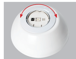
Justering av spridningsvinkel